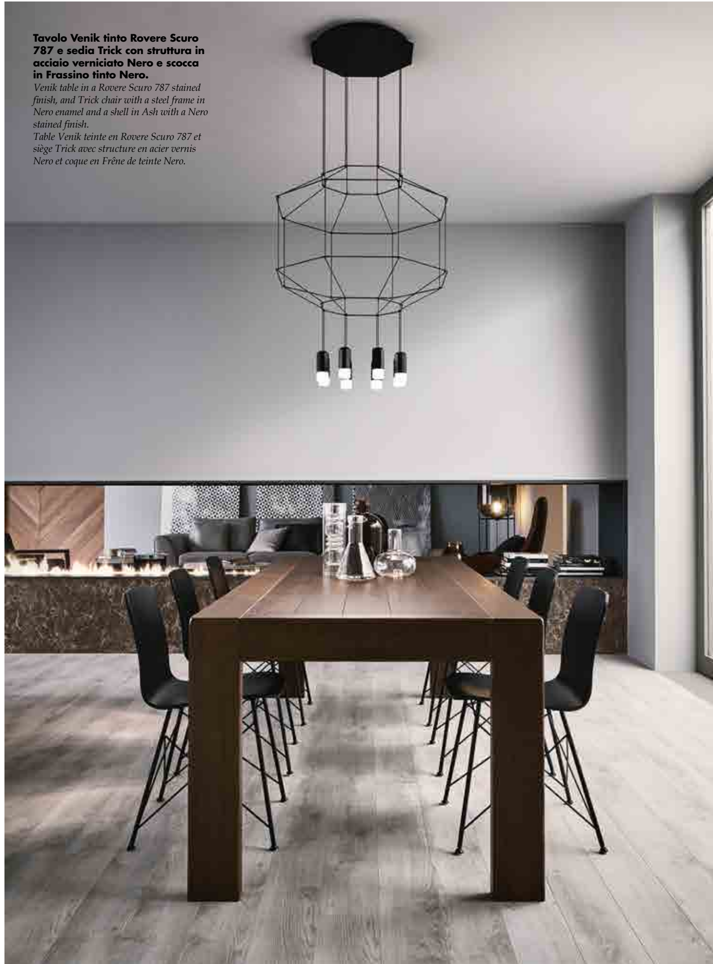
Table Venik teinte en Rovere Scuro 787 et siège Trick avec structure en acier vernis Nero et coque en Frêne de teinte Nero.

Venik table in a Rovere Scuro 787 stained finish, and Trick chair with a steel frame in Nero enamel and a shell in Ash with a Nero stained finish.